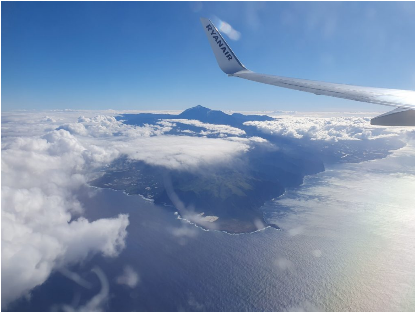
Links unten ist Garachico, rechts die Ankerbuchten Playa de Masca und Baranco Seco