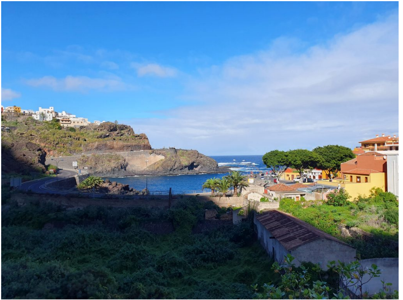
Alter Hafen Garachico