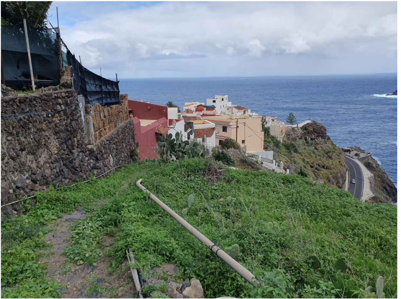
Immer Aufwärts...700 Höhenmeter.