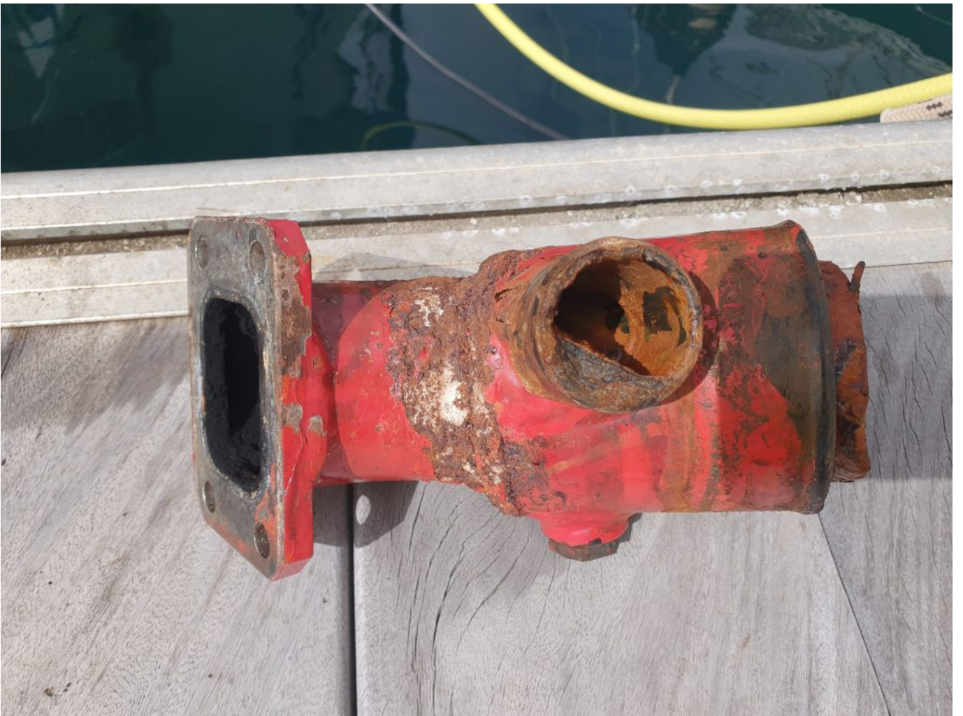
Wunsch...ein neuer Krümmer. Wird leider nicht mehr hergestellt. ☐