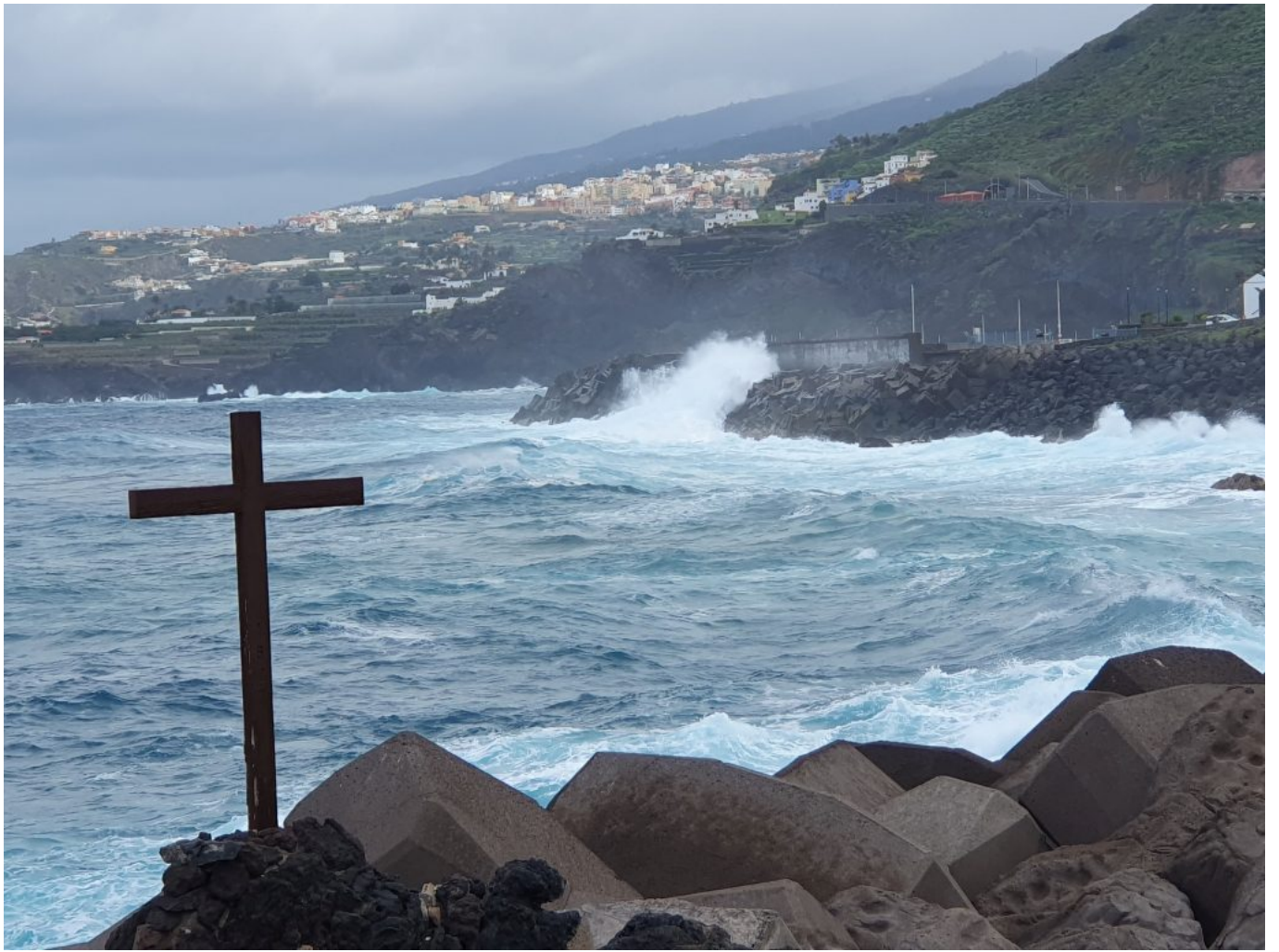
Mieses Wetter...hinter der Mauer ist die Marina.