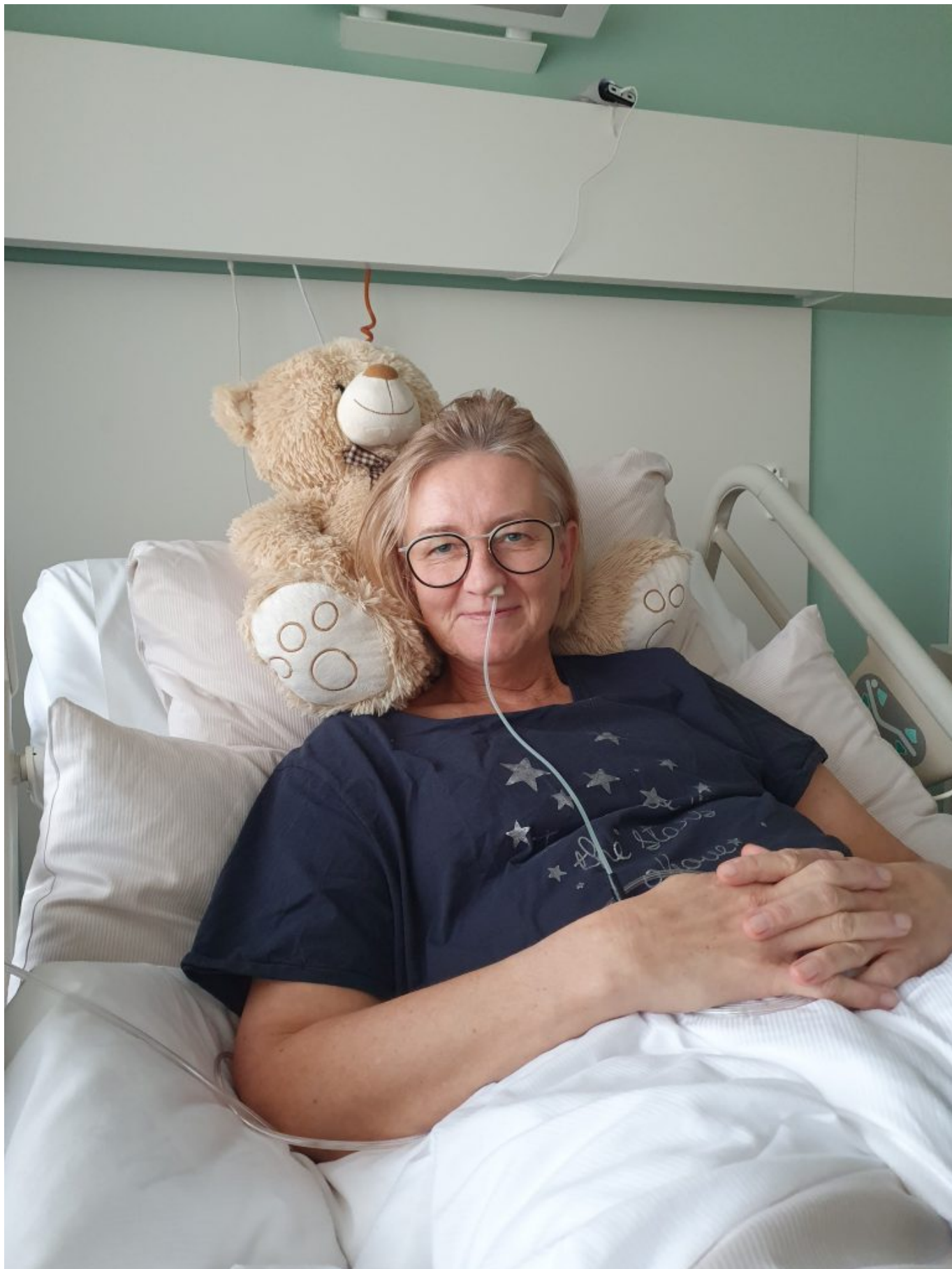
Letzte große OP