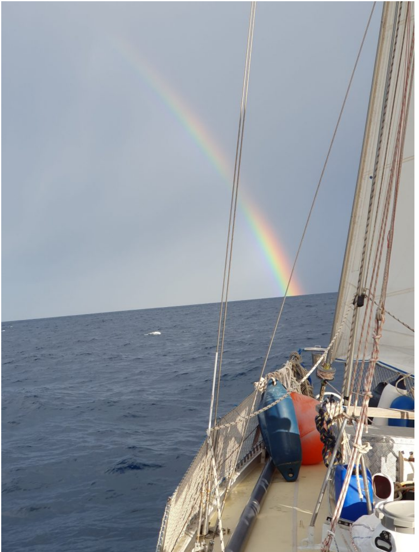
Da hinten liegt der Topf mit Gold (oder Gran Canarias)