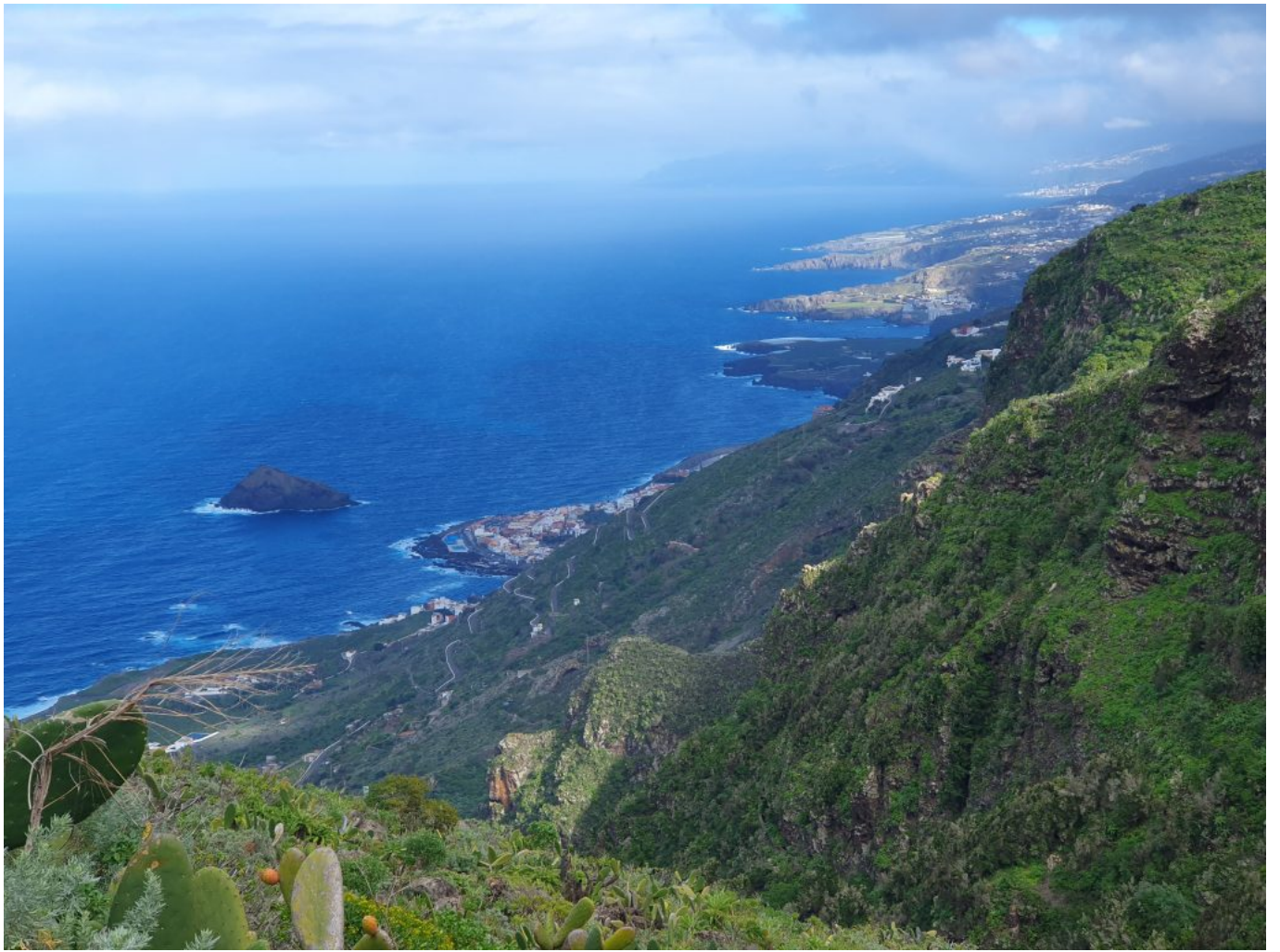
Weit oben und ziemlich fertig.