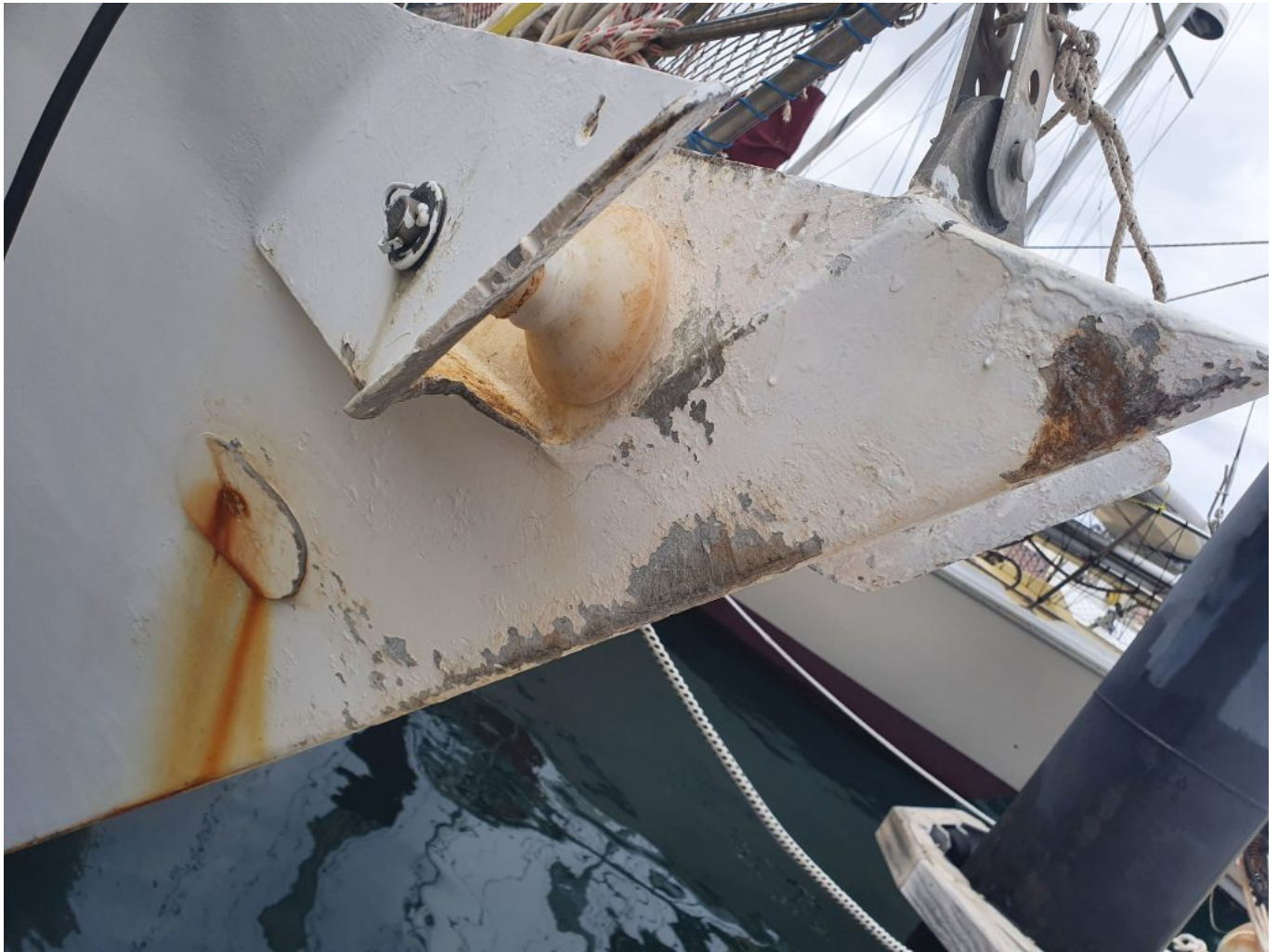
Schäden durch Anker