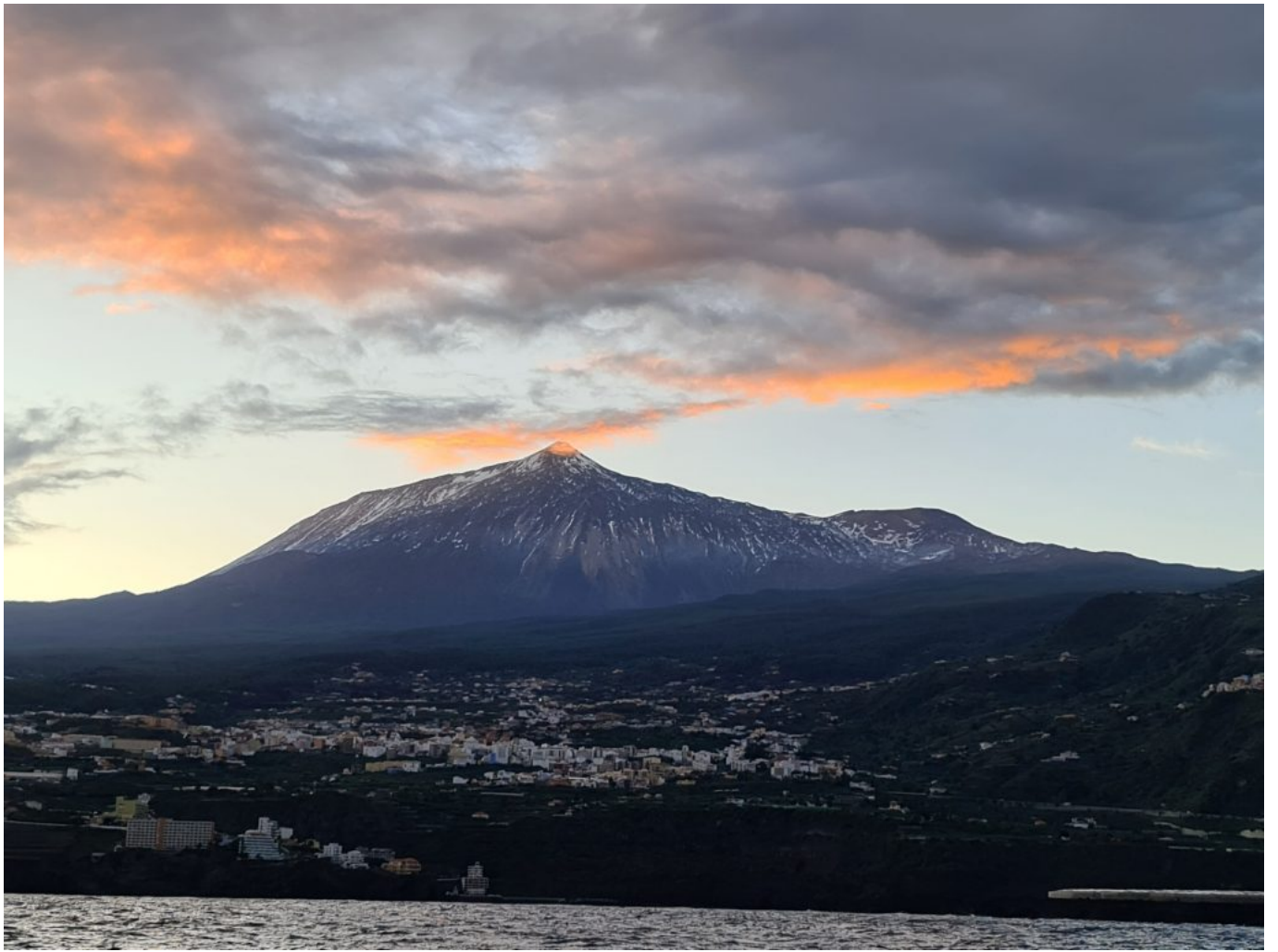
der Teide, immer wieder eindrucksvoll.