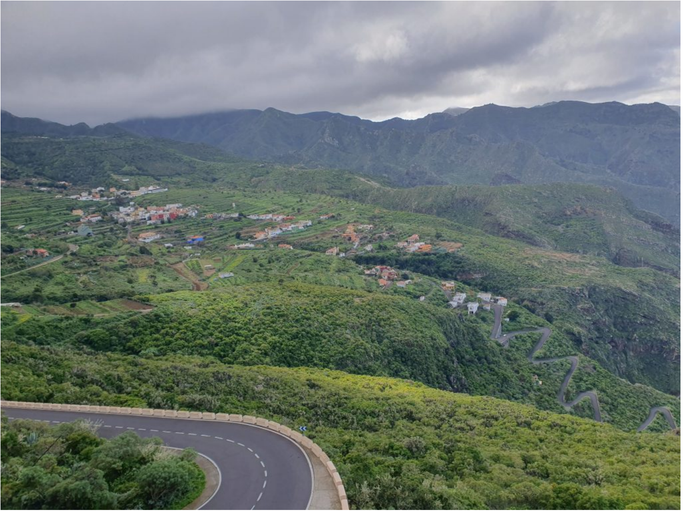
Tierra de Trigo