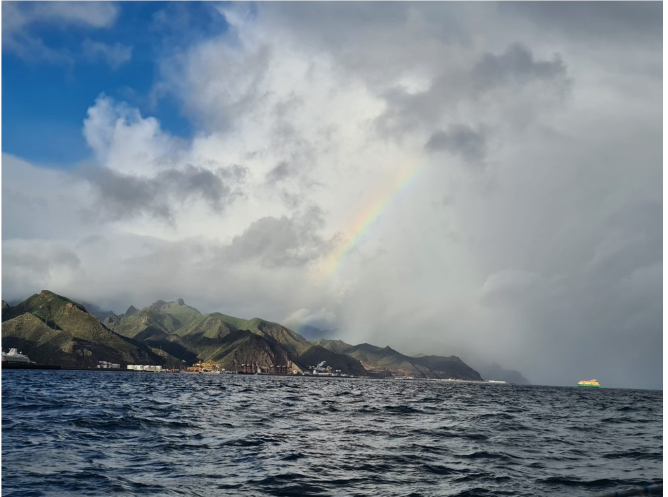
Rückblick auf Teneriffa

Morgens kurz vor Helligkeit sind wir in Las Palmas de Gran Canaria angekommen. Wir verbrachten eine Nacht vor Anker und am Abend des 2. Tages durften wir überraschend in den Hafen. Wir haben erst einmal für 2 Monate gebucht. Einige Reparaturen und Neuanschaffungen (z.B. E-Außenbordmotor) stehen auf unserer Wunschliste. Unser alter Yamaha 3PS 2-Takter geht in Rente.