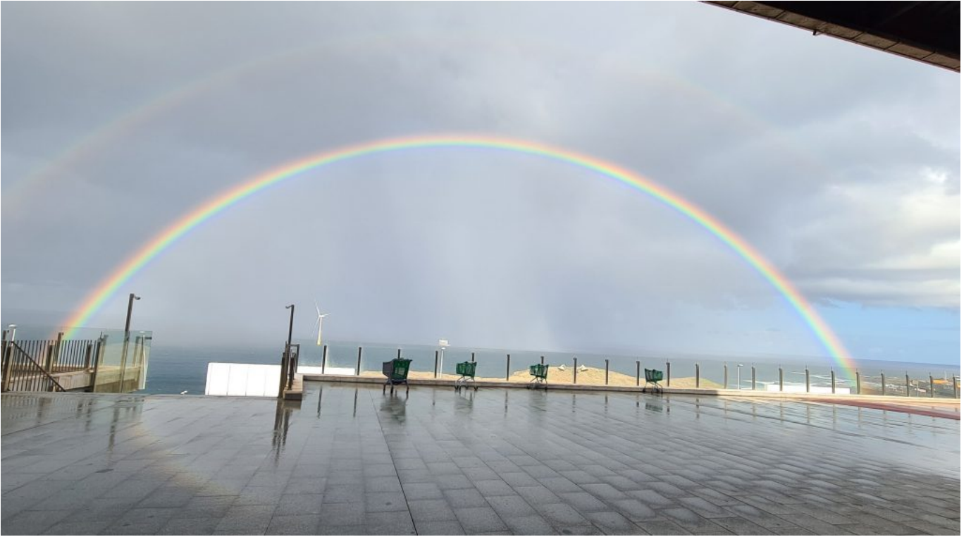
Vom Einkaufszentrum aus.