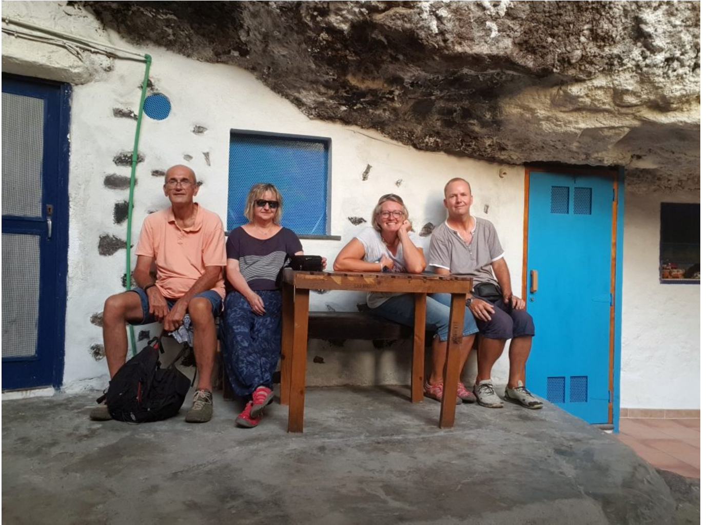
Porís de Candelaria (Piratendorf)

Nachts sind wir auf den Roque de los Muchachos hochgefahren um den Meteorittenschauer anzusehen aber leider haben wir die Rechnung ohne den Halbmond gemacht. Es war einfach zu hell.