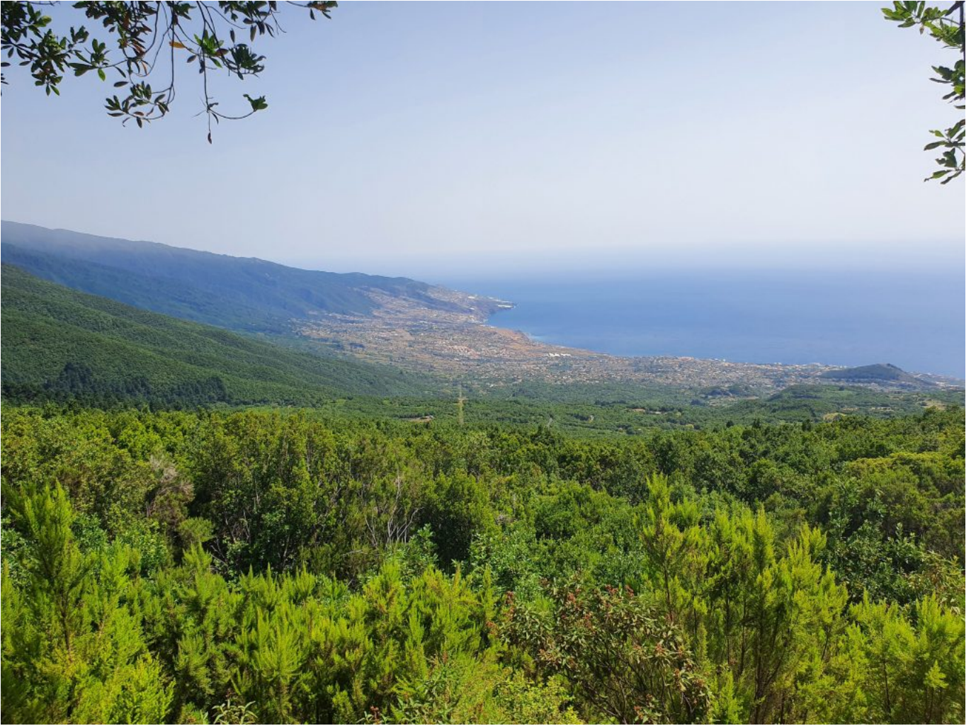
Santa Cruz de La Palma von oben