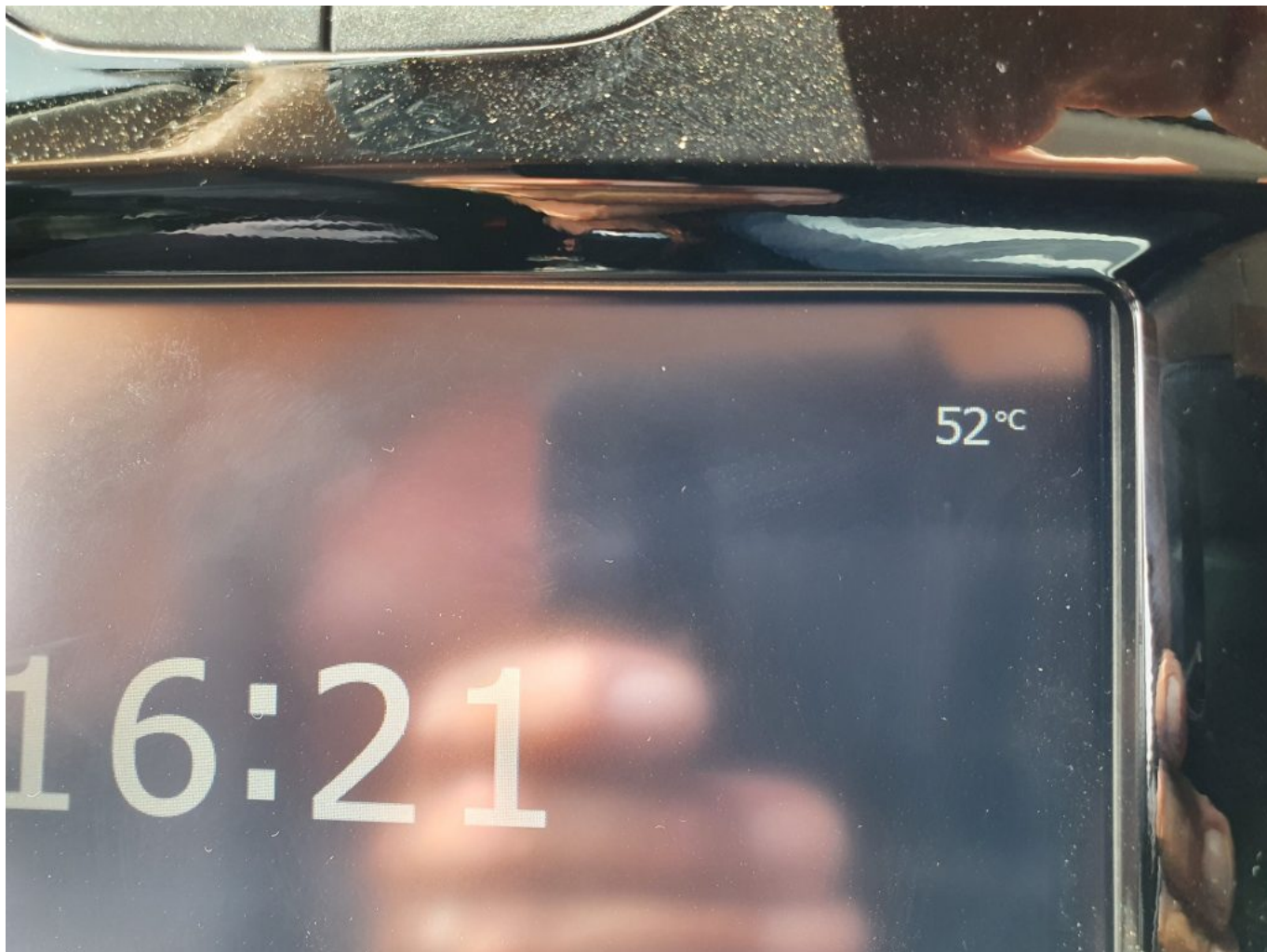
Tzacorte hatte max. 47 Grad