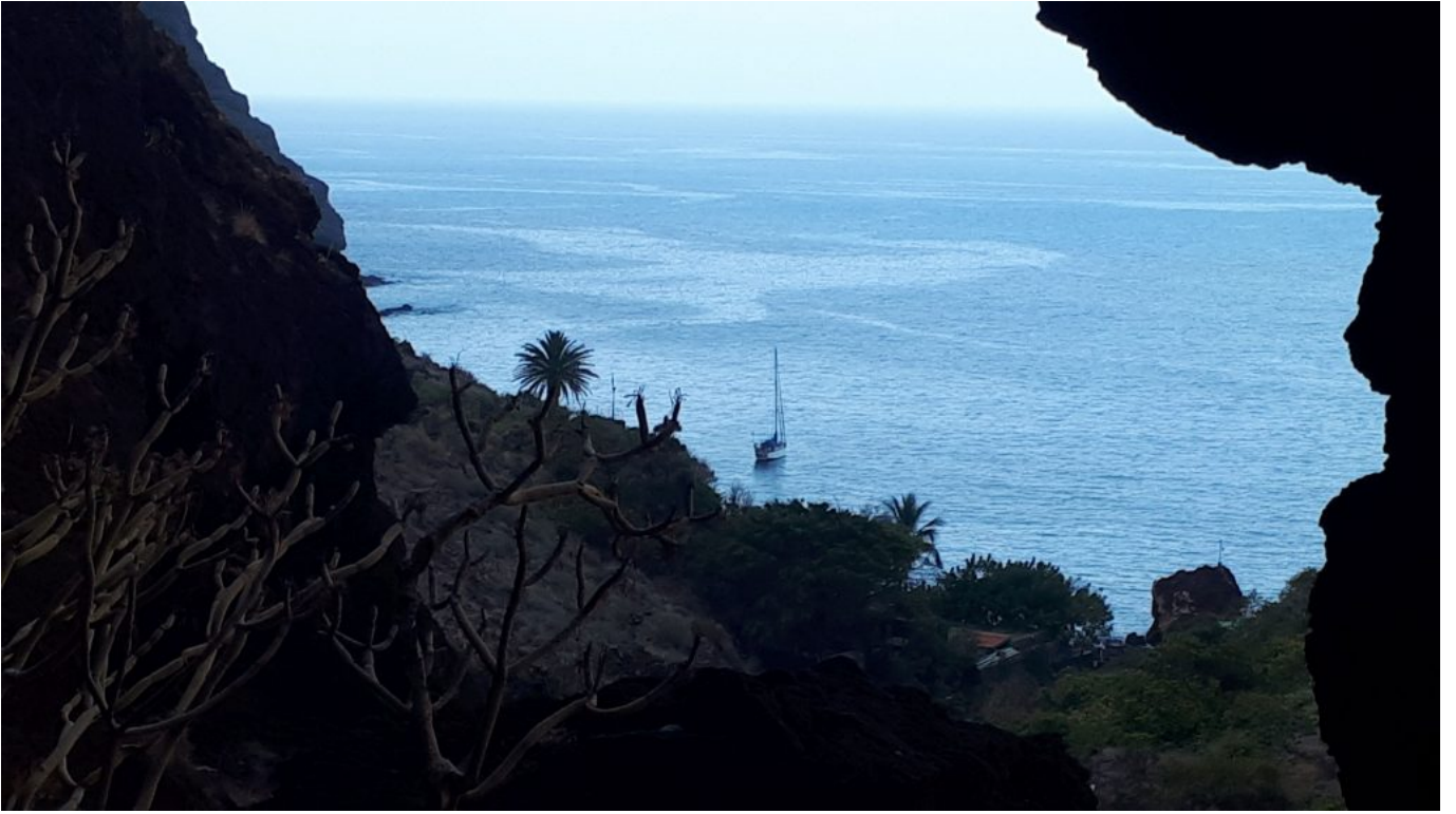
Desi noch alleine