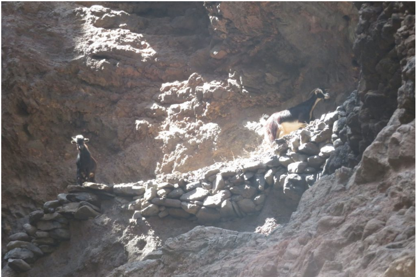
Ziegen, im Video schau ich mich da oben um.