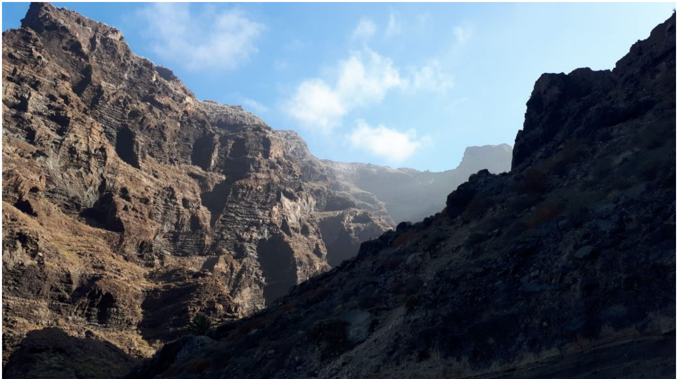
erster Blick nach oben

Morgens ging es los. Ans Ufer rudern, Boot sichern, umziehen und ab dafür.