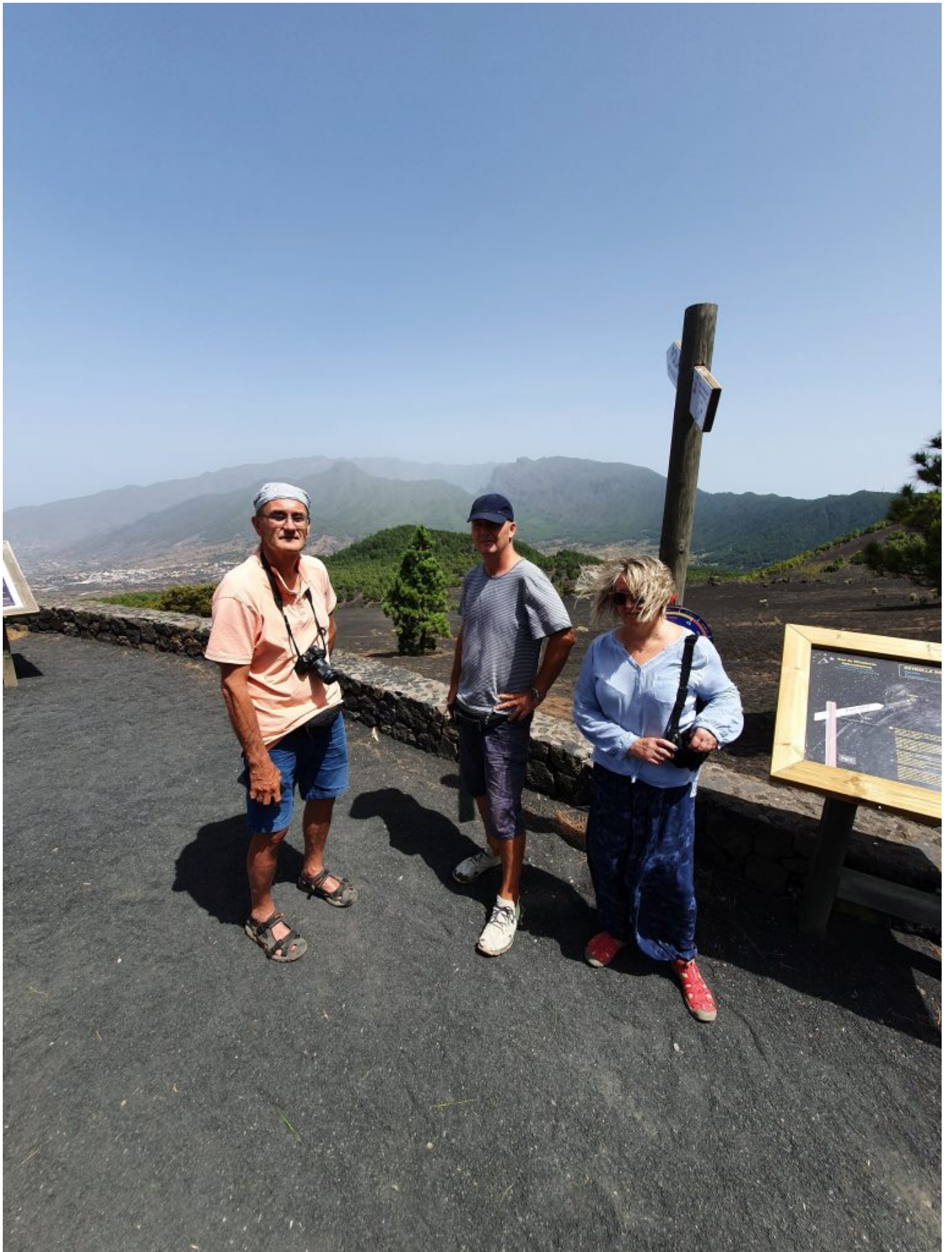
Am letzten Tag ging es noch im Süden zu den Lavafeldern und den Salinen am Meer. Immer wieder wunderschön, auch wenn wir fast alles schon mehrere Male gesehen haben.