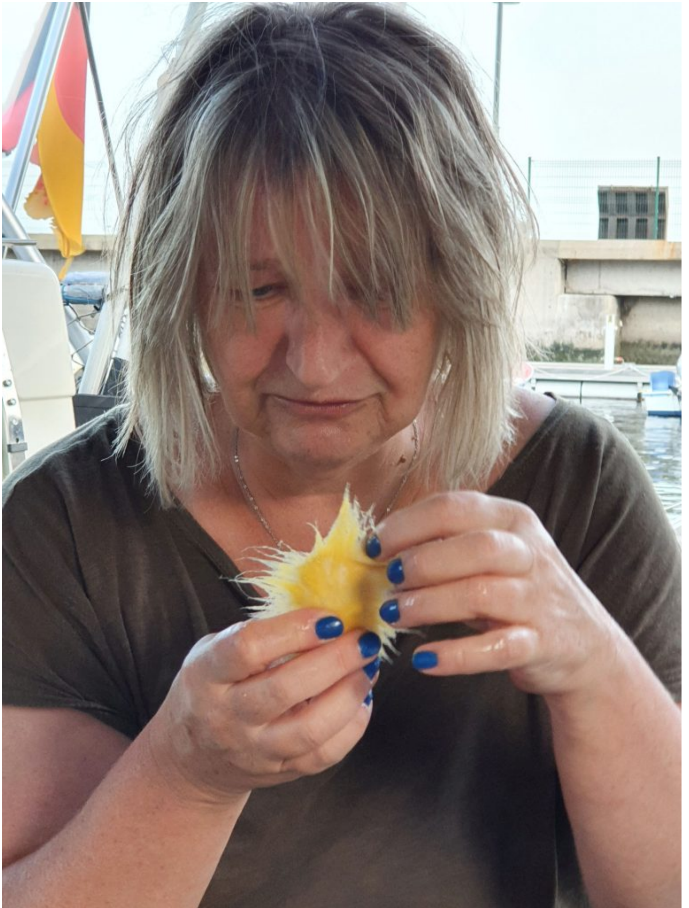
Bootskoller?? Mango essen, nicht essen?