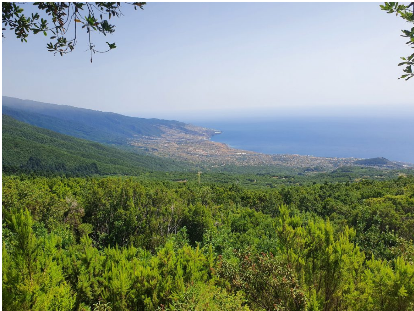
Santa Cruz de La Palma von oben