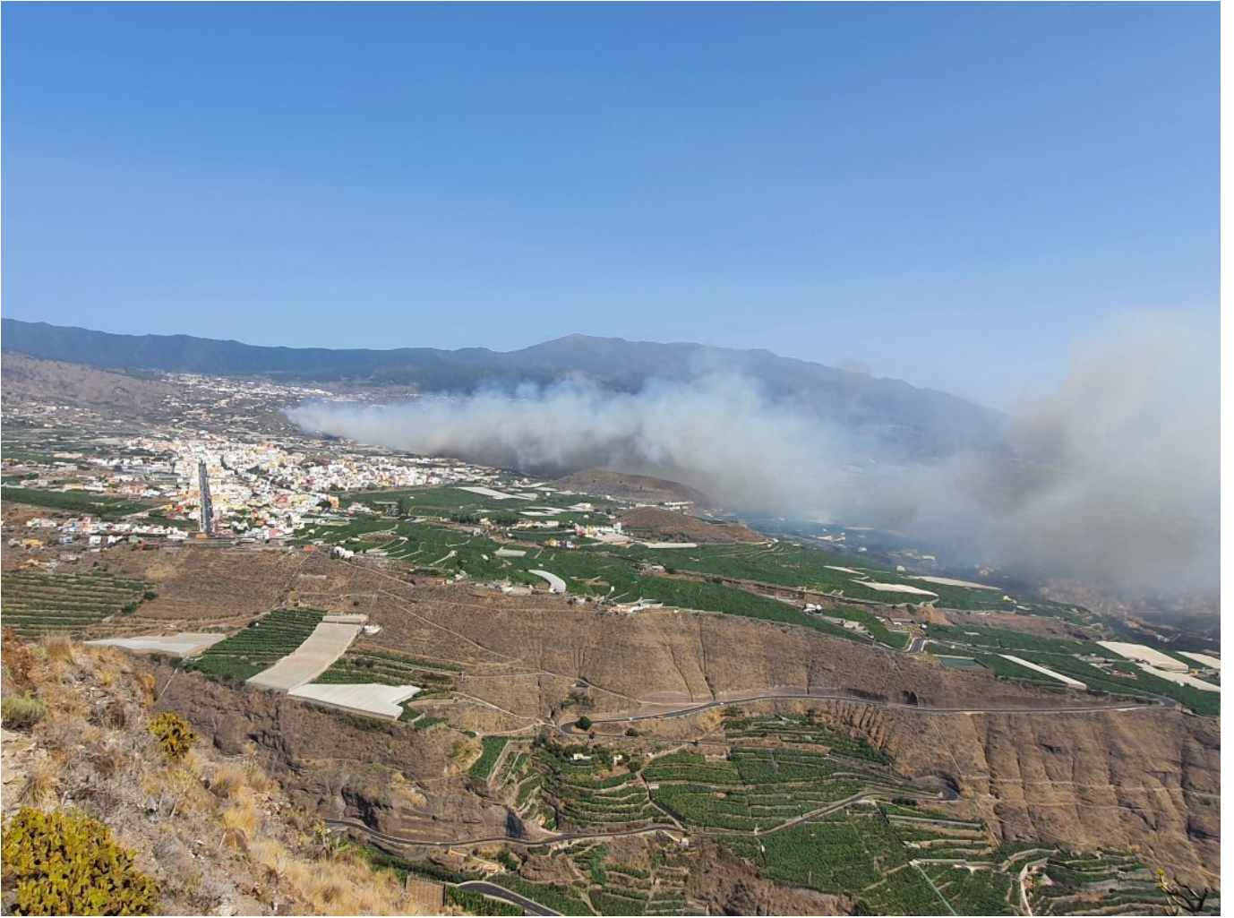
Brand in El Paso