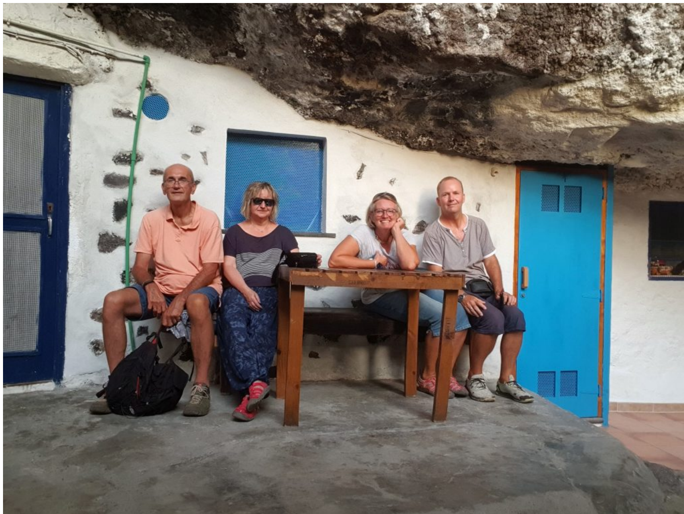
Porís de Candelaria (Piratendorf)

Nachts sind wir auf den Roque de los Muchachos hochgefahren um den Meteorittenschauer anzusehen aber leider haben wir die Rechnung ohne den Halbmond gemacht. Es war einfach zu hell.