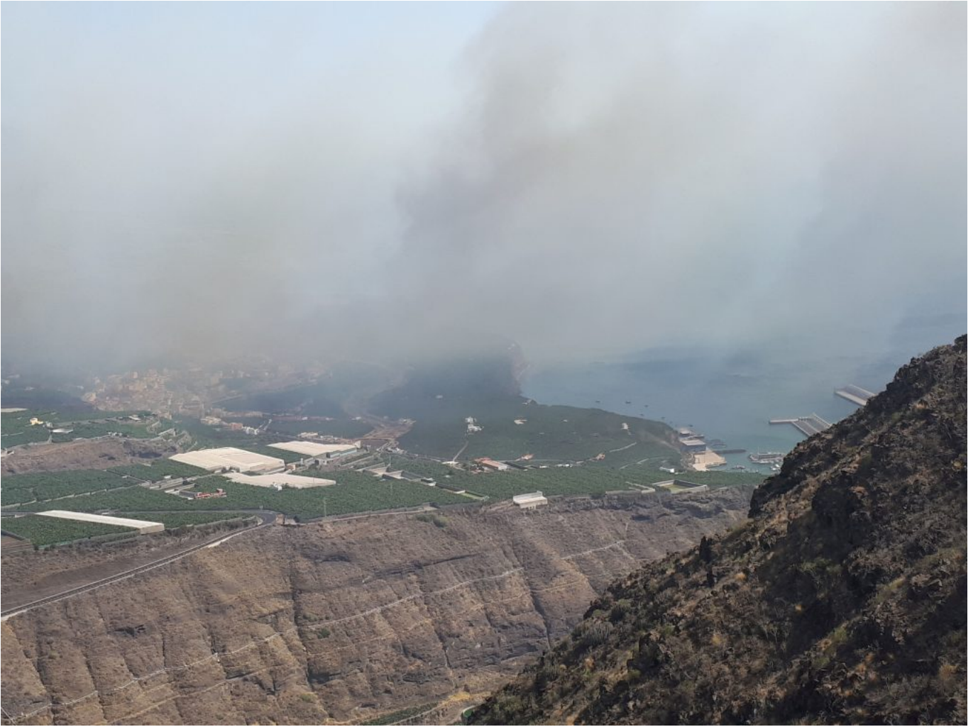
Ankerlieger Tazacorte im Rauch