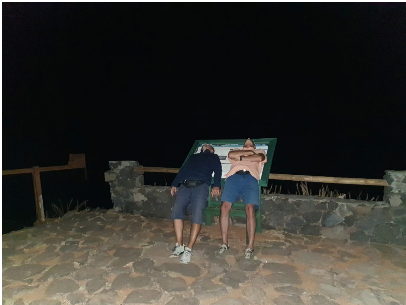
In den Himmel schauen ohne Nackenschmerzen