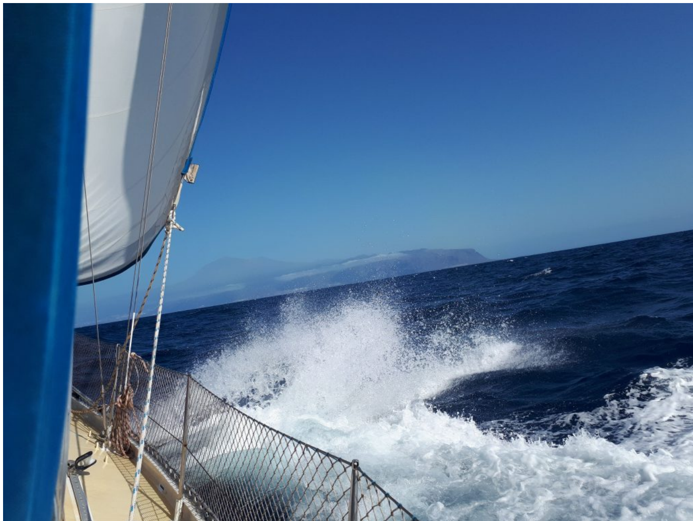
Platschen bis zum Stillstand

Am Montag erster Ausflug ins Städtchen. Impfzentrum war ausgeschrieben und ab 15:00 Uhr ging es ohne Termin. Wir kamen um 14:30 Uhr zurück und hatten 5 Minuten später unsere 2. Impfung mit Biontech. Hurra.