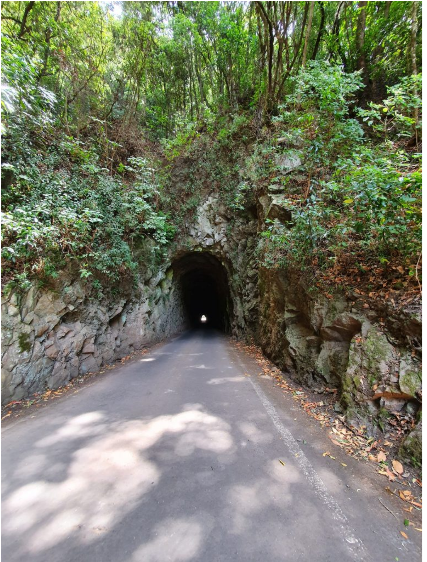
Tunnel durchs Grün