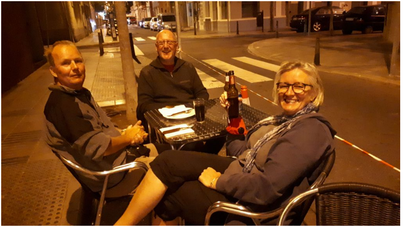
Draussen durfte man sitzen...Terrasse in den Parkbuchten auf der Strasse.