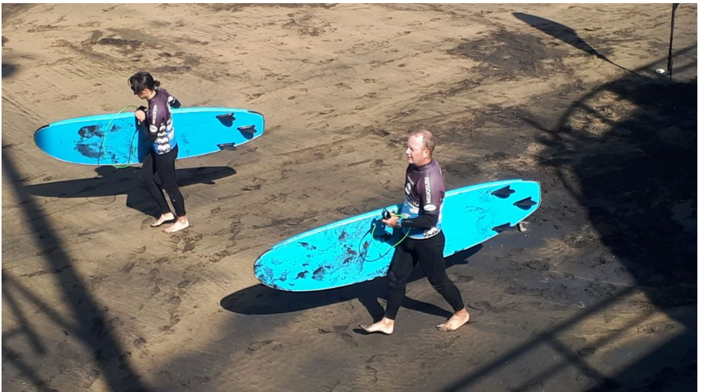
ab ins Wasser...ich bin einmal zum Stehen gekommen.