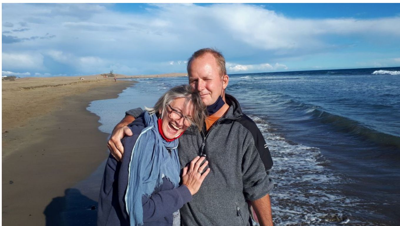
Strand / Dünen Maspalomas