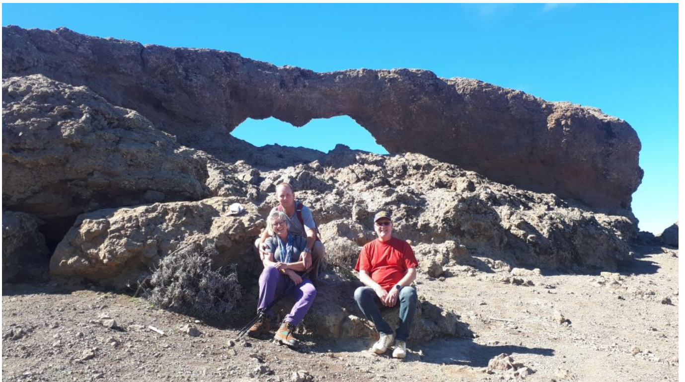
Ausruhen am Ventana del Nublo