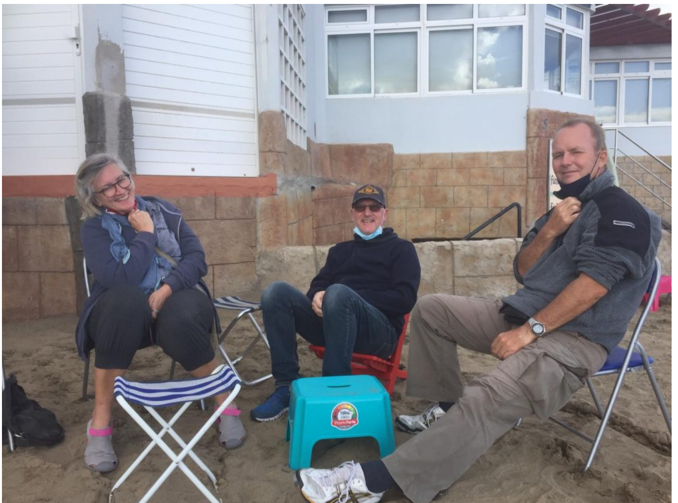
Strand / Dünen Maspalomas - ausruhen + was trinken