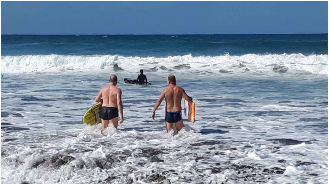
Bodyboarden am Strand von las Canteras

Nun geht es am nächsten Dienstag weiter. Erst südlich zu Ankerstellen von Gran Canaria dann weiter mit kurzem Zwischenstop in Teneriffa nach La Gomera. Wir freuen uns schon darauf.