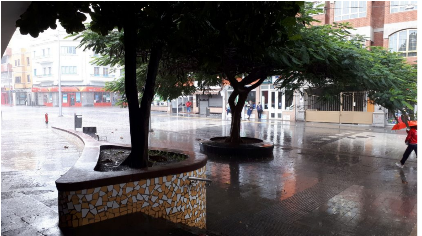
Ja, hier regnet es auch mal richtig!