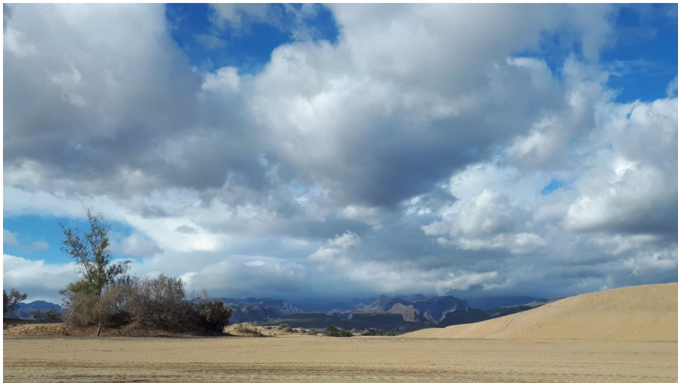
Strand / Dünen Maspalomas