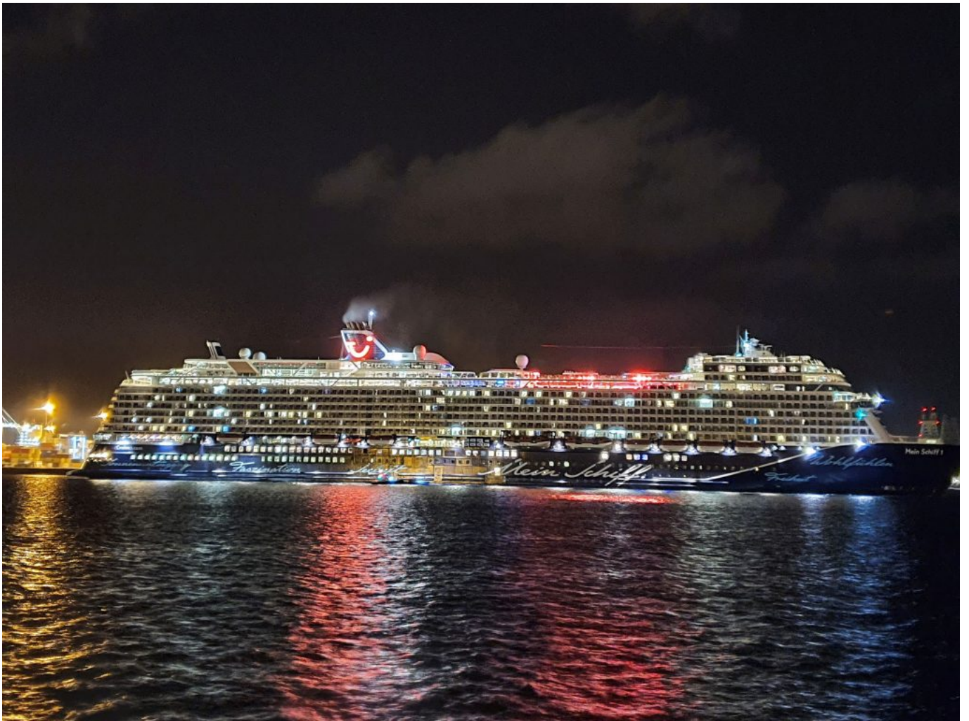
Ludmilla und Rainer auf Abfahrt aus Las Palmas...Viel Spaß und bis bald.