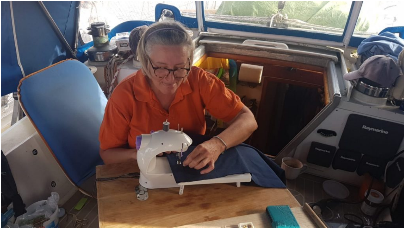
Neue Nähmaschine und erste Projekte