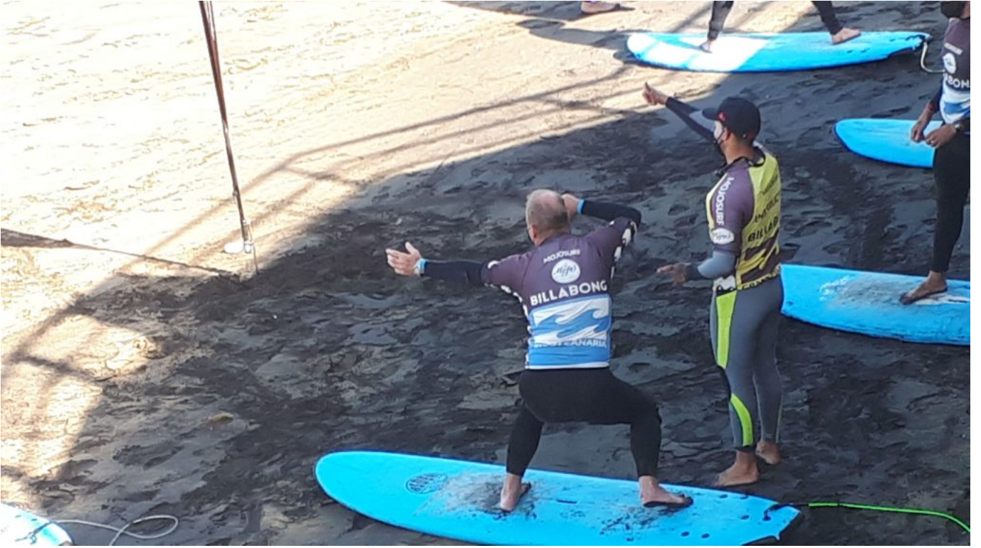
Surfschule, noch im trockenen