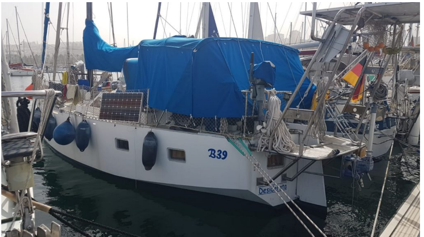
unsere neue Bude gegen schlechtes Wetter und Wind.