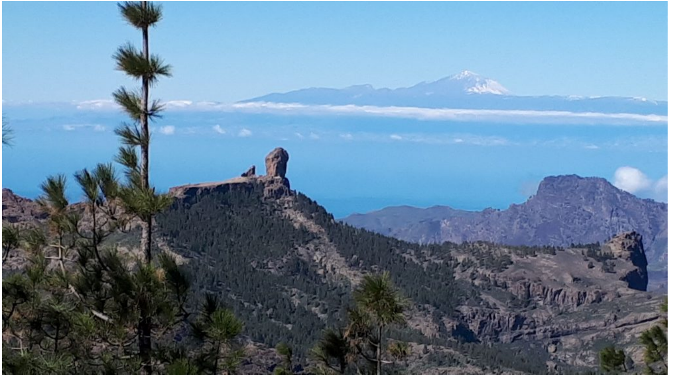
Blick auf den Nublo und auf den Teide in Teneriffa

Pico des Schnees (Nieves)...etwas davon war noch zu finden. 10 Tage vorher war alles hier gesperrt...Schneechaos!